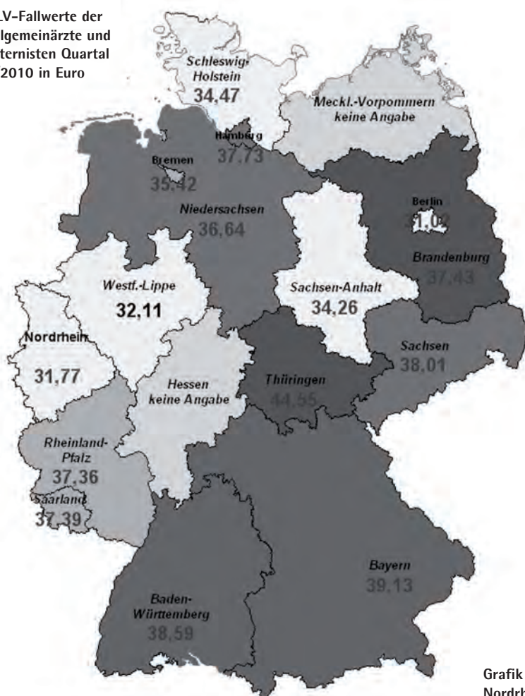
RLV-Fallwerte der Allgemeinärzte und Internisten Quartal 1/2010 in Euro