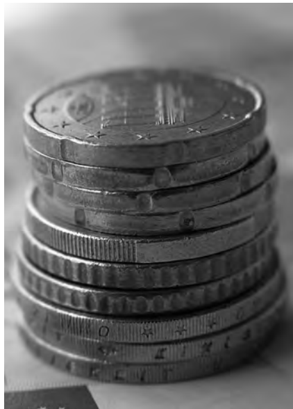
Verlockend: Selektive Hausarztverträge locken mit üppigen Pauschalen. Doch die Zeche könnten am Ende die Patienten bezahlen.

Auf Basis dieser Eckpunkte sollen die Landesverbände noch im Mai Vollversorgungsverträge entwickeln und abschließen, auch in Nordrhein-Westfalen. Dann sollen sich die Versicherten der TK ein-