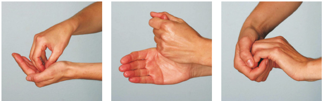
Einreibemethode zur Händedesinfektion: Aktion Saubere Hände

Nach Empfehlung der „Aktion Saubere Hände“, einer nationalen Kampagne zur Verbesserung der Compliance der Händedesinfektion in deutschen Gesundheitseinrichtungen 3 , soll die hygienische Händedesinfektion unter der besonderen Berücksichtigung von Hauptkontaktstellen und Erregerreservoirien erfolgen. Besondere Aufmerksamkeit gilt dem Einreiben von Fingerkuppen, Nagelfalzen und Daumen.